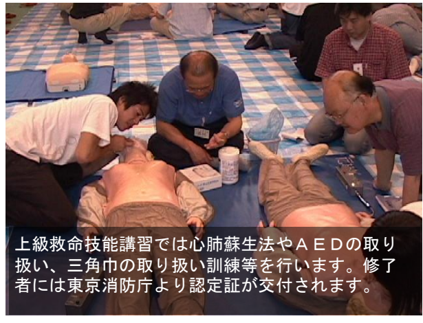
上級救命技能講習では心肺蘇生法やAEDの取り扱い、三角巾の取り扱い訓練等を行います。修了者には東京消防庁より認定証が交付されます。