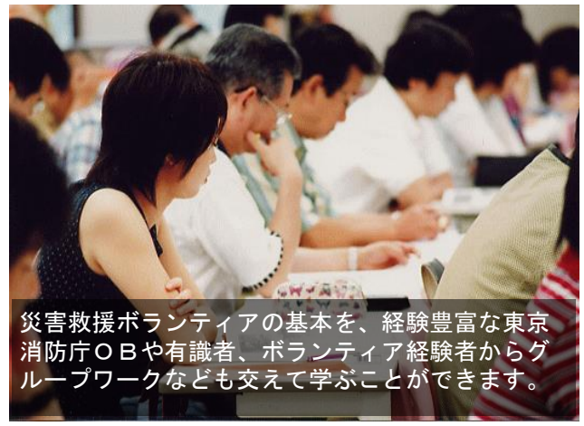
災害救援ボランティアの基本を、経験豊富な東京消防庁OBや有識者、ボランティア経験者からグループワークなども交えて学ぶことができます。