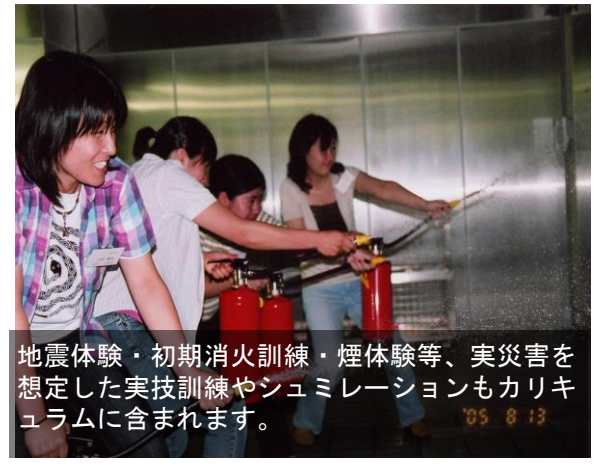
地震体験・初期消火訓練・煙体験等、実災害を想定した実技訓練やシミュレーションもカリキュラムに含まれます。